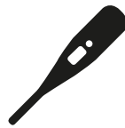
Verhoging of koorts